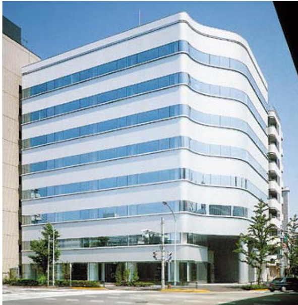
外観 ★交差点に面しており、視認性良好