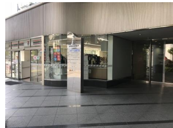
エントランス ★1階コンビニあり