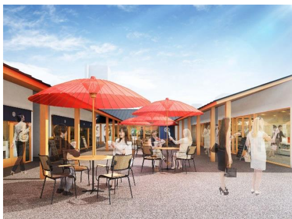
広島城三の丸エリア東側に位置する 第1期エリアのイメージ

三の丸には、武家茶道・上田宗箇流の世界を身近に感じられる「SOKOカフェ（仮称）」をはじめとした飲食店や地元産品を扱うみやげ物店を整備します。神楽などを上演できる多目的の広場やマイカー駐車場も設け、観光客や市民が楽しめる場所とする計画です。