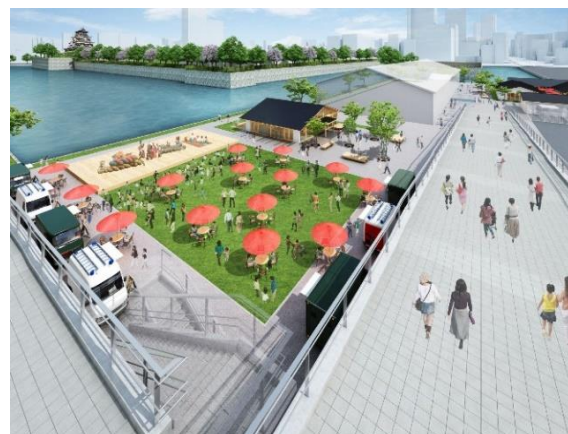
広島城三の丸エリア北西側に位置する 第2期エリアのイメージ

広島城アソシエイツの強みを生かし、テレビ・ラジオ・新聞・デジタルメディア・SNSを駆使した情報発信にも力を入れ、多くの人々に広島城三の丸エリアの魅力を伝える取り組みを行うほか、周辺の観光スポットとも協力し、平和記念公園や紙屋町・八丁堀地区の各種施設とも連携して集客に取り組み、広島都心の回遊性を高めていきます。