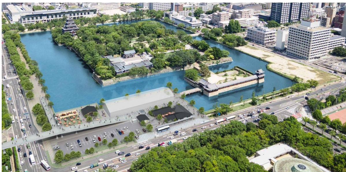
南側から見た広島城全体のイメージ

つまり、温故知新——この言葉を本事業のコンセプトとして掲げます。私たちは、広島城を歴史と文化に触れる場所として見つめなおし、観光拠点としてのポテンシャルを最大限に引き出します。